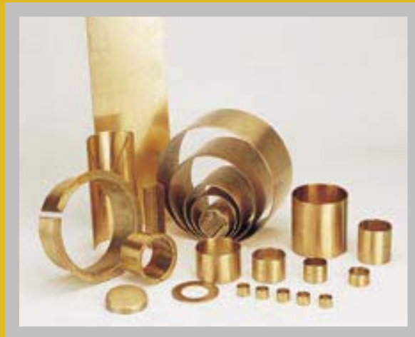
GEROLLTES BRONZEGLEITLAGER, SCHMIERTASCHEN, WARTUNGSARM