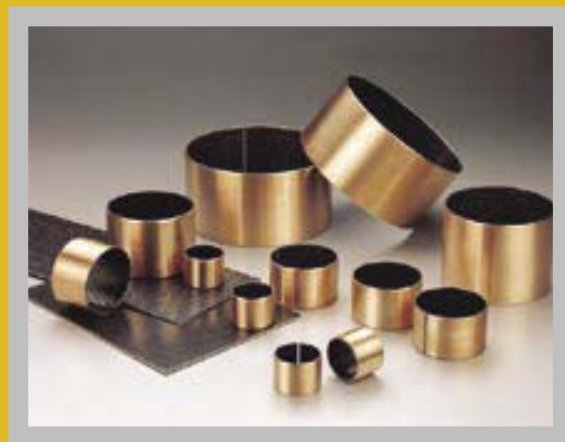
GEROLLTES VERBUNDGLEITLAGER, STAHL / PEEK, WARTUNGSARM