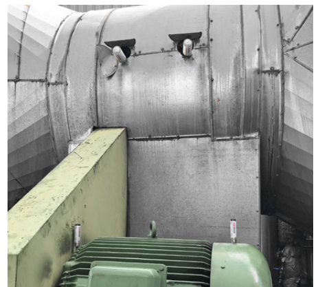
Schmierung der Lager einer Lüftungsanlage mit simalube 125 ml und 15 ml.