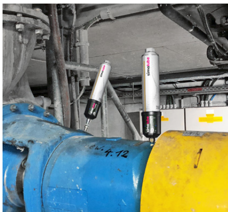
Die Lager der Pumpe werden mit zwei IMPULSE und simalube 250 ml geschmiert.