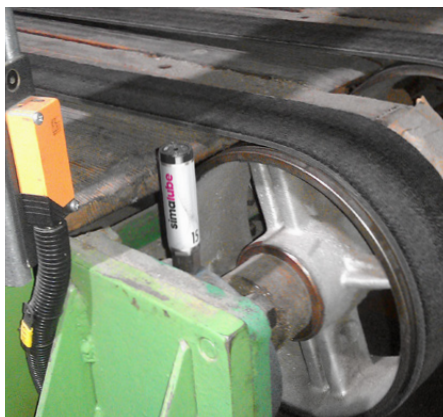
Die Lager der Transportbänder in einer Wellkartonfabrik werden kontinuierlich mit dem simalube Schmierstoffgeber geschmiert.