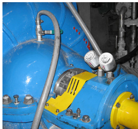
Zwei simalube 30 ml schmier das Lager einer Pumpe.