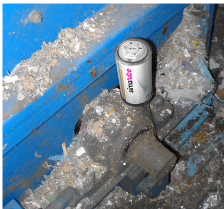
In einer Papierfabrik wird das Stehlager eines Schredders mit einem simalube 125 ml geschmiert.

«Erhebliche Zeitersparnis und verbesserte Arbeitssicherheit dank automatischer Schmierung»