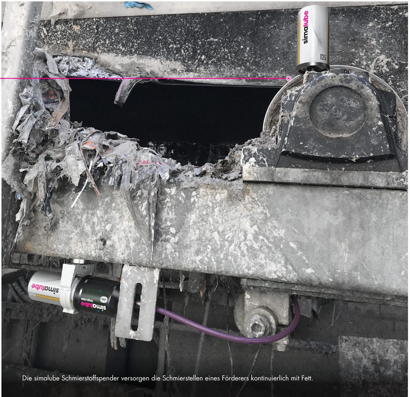
Die simalube Schmierstoffspender versorgen die Schmierstellen eines Förderers kontinuierlich mit Fett.