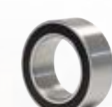
› Magnetlager für Klimaanlage