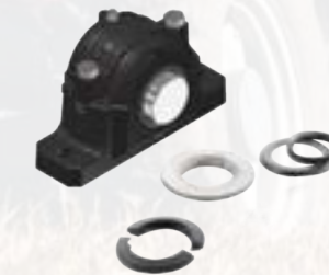
» Dichtungen und Ringe für Gehäuse