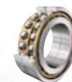
› Doppelreihige Schräggugellager