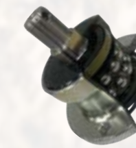
» AGRI HUB Lager