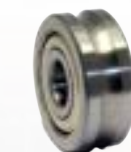
› Laufrollenlager / Rollenlager